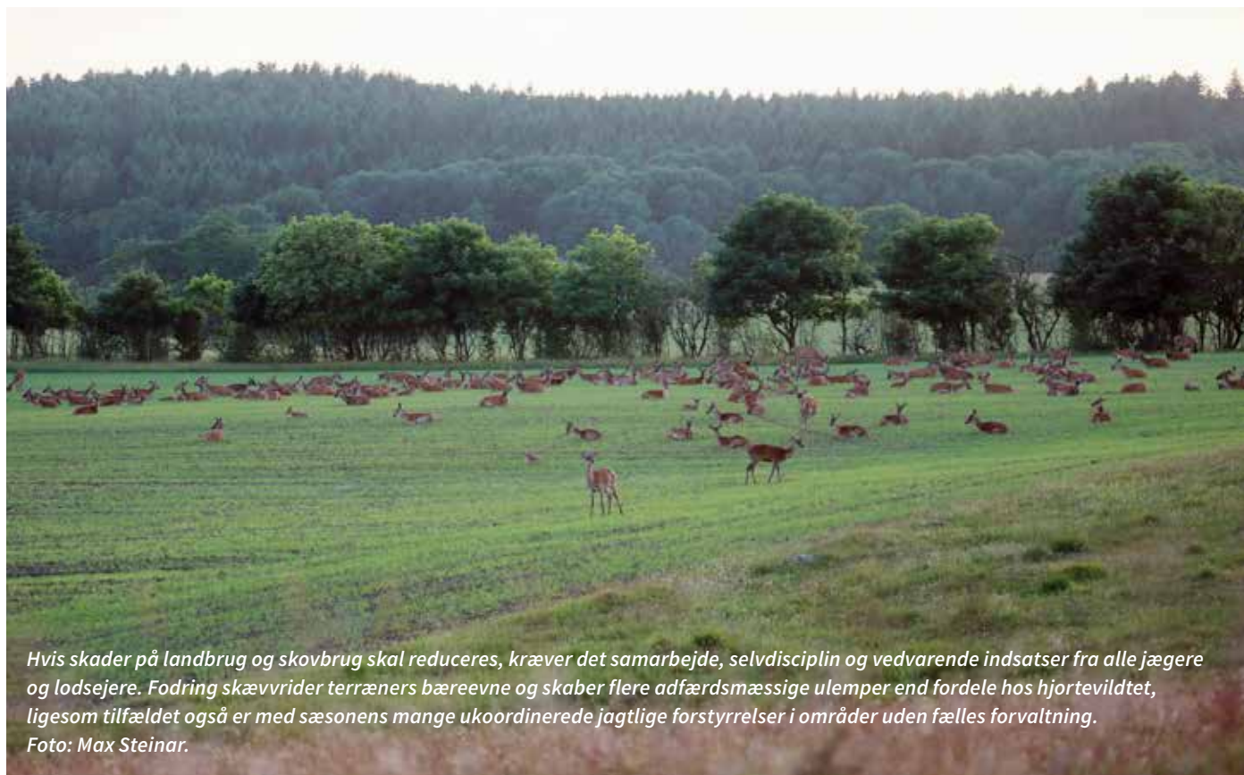
Hvis skader på landbrug og skovbrug skal reduceres, kræver det samarbejde, selvdisciplin og vedvarende indsatser fra alle jægere og lodsejere. Fodring skævvrider terrænets bæreevne og skaber flere adfærdsmæssige ulemper end fordele hos hjortevildtet, ligesom tilfældet også er med sæsonens mange ukoordinerede jagtlige forstyrrelser i områder uden fælles forvaltning.