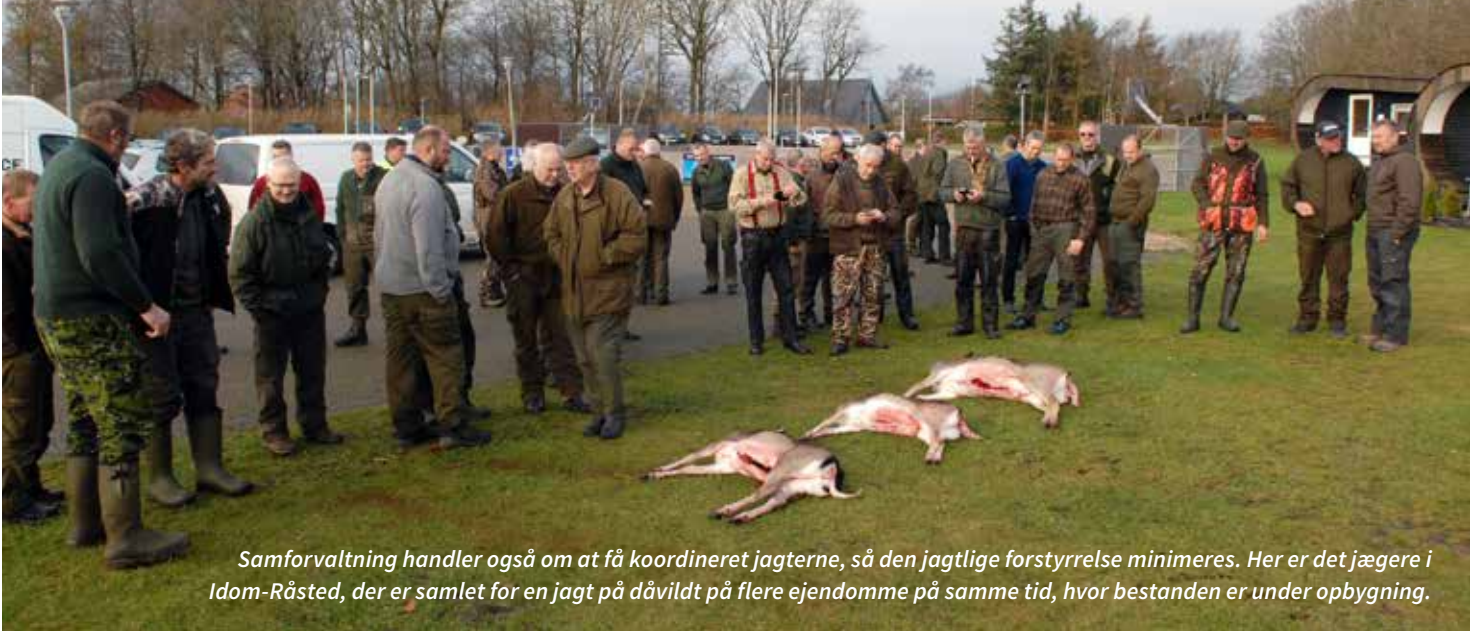
Samforvaltning handler også om at få koordineret jægterne, så den jagtlige forstyrrelse minimeres. Her er det jægere i Idom-Råsted, der er samlet for en jagt på dåvildt på flere ejendomme på samme tid, hvor bestanden er under opbygning.

En kvalificeret forvaltning af råvildt og dåvildt vil styrkes af et samarbejde på tværs af skel, og vil under de rette omstændigheder føre til sunde og robuste bestande.