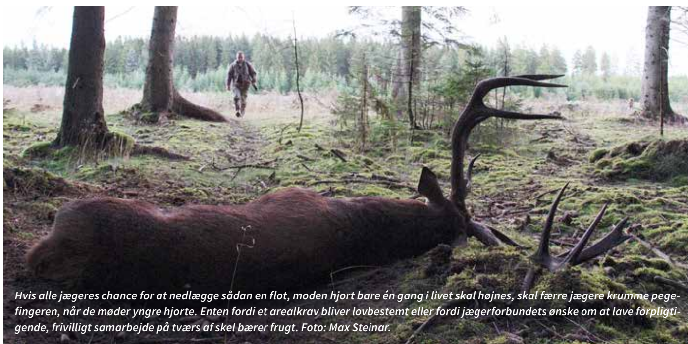
Hvis alle jægers chance for at nedlægge sådan en flot, moden hjort bare én gang i livet skal højnes, skal færre jægere krumme pegefingeren, når de møder yngre hjorte. Enten fordi et arealkrav bliver lovbestemt eller fordi jægerforbundets ønske om at lave forpligtigende, frivilligt samarbejde på tværs af skel bærer frugt.