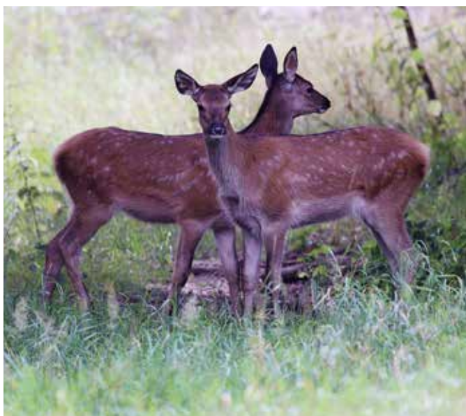
Godt jægerhåndværk kræver, at man har fokus på kalvene først, både i afskydningen og i bestandsovervågningen.

Store fællesjagter vinder frem i regionen, og det opleves, at denne metode skaber ro i skovene og en mere naturlig