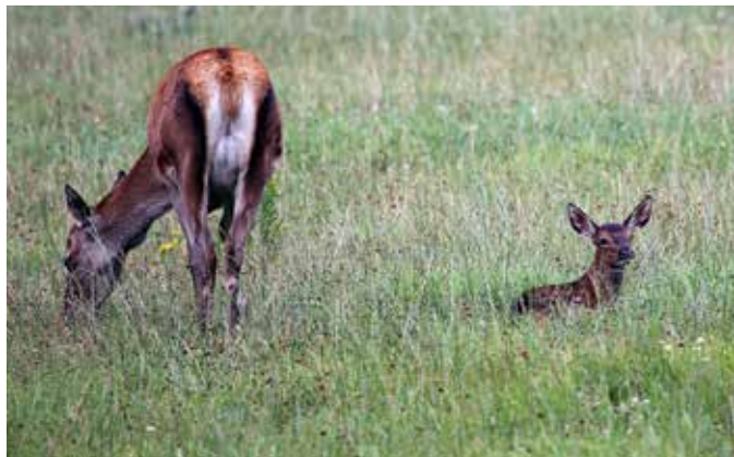
Kalven følger hinden i halvandet år – hinden har altså 18 måneder til at oplære kalven i at overleve og føre generne videre. Det er primært jægerens ansvar gennem jagtfred og jagtlig forstyrrelse at oplære hinden i henholdsvis ønsket og uønsket adfærd.

Efter første jagtsæson med reduceret jagttid på hjort +to år er der flere områder, der melder om et stigende antal hjorte. Hjortevildtgruppen har forventet denne udvikling,