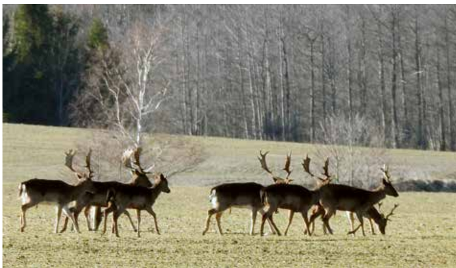
Hvis ikke hjortevildtet skal forvaltes ligeså irrationelt og egennyttigt som hamstringen af toilet-papir, da COVID-19 pandemien brød ud, lige så skal de dårlige undskyldninger om nabo-jægerens afskydning droppes, og vi må begynde at tage ansvar for egne handlinger.

Afskydningen vurderes generelt som ganske passende og afstemt med forholdene. Afskydningen af handyrene ser ud til at bære frugt. Det er