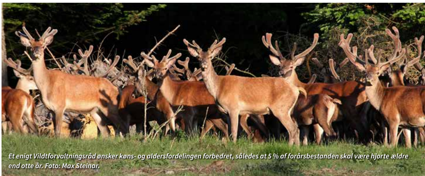
Et enigt Vildtforvaltningsråd ønsker køns- og aldersfordelingen forbedret, således at 5 % af forårsbestanden skal være hjorte ældre end otte år.